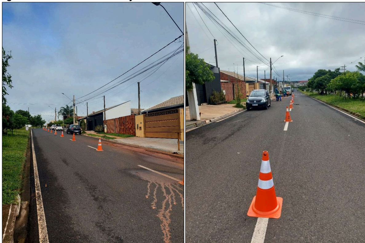
Figura 1 - Início das Obras em janeiro de 2025