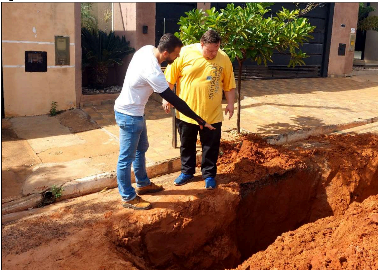
Figura 4 - Visita técnica realizada na data de 14/02/2025