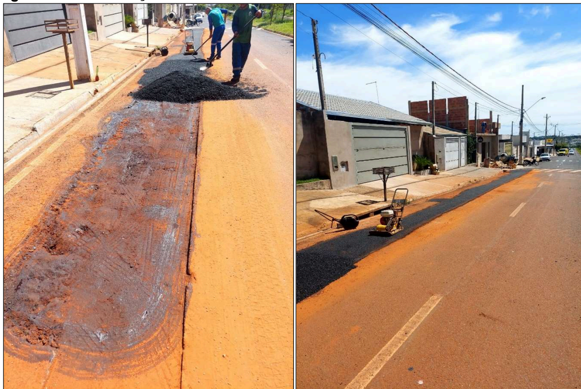
Figura 3 - Pavimentação Asfáltica dos trechos finalizados